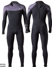
A: BLACK & CHARCOAL Strip: BLACK Stripe-BLK

選んだヘビーウェーター・コンディションに対応すべく開発されたオーセンティックなバックジップモデル。首の動きに追従する HYDRO NECK SEAL がズリからの水の侵入をしっかりとガード。ストリップ/リアーとショルダージップを組み合わせた BARRIER ENTRY を採用し、ジップからの漏水を防ぎ高い防水性を確保した。妥協が許されないシリアスな環境に挑むサーファーからオールラウンド・サーファーにお勧め。日本製。