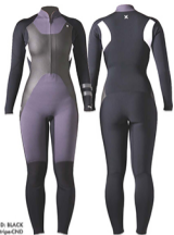
A: SLATE B: WHITE C: CHARCOAL D: BLACK SINK: CHARCOAL SHIP: CHD

深に脱着できるウイメンズ専用のフロントオープンジップモデル。防水性と保温性に優れ、動体関節から生みだされたフレックスフォーム・パターンがシンプルなデザインと動きやすい運動性もキープ。膝の運動性と耐久性を両立するTUFF KNEE SHIELD、手首からの浸水を防ぐDRY CUFF。体幹部のラバーパネルがボディを引き締めスタイリッシュに演出。肌触りがよく伸縮性に優れたCSD3、またはコストパフォーマンスが高いNITROから選択可能。日本製。