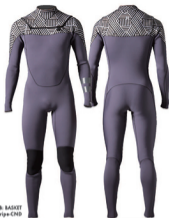
A: CHARCOAL & BASKET Strip: BLACK Stripe-CND

使い勝手がよく兼用性が抜群のHYDRO SEAL ENTRY 4.4システムをネックホールに採用したトップアスリートモデル。快適な着用感と優れた運動性が特長だ。究極のパフォーマンスをサポートするFLEXFORM PATTERNINGや、膝の運動性と耐久性を両立するTUFF KNEE SHIELD、手首からの漏水を防ぐDRY CLIFFなど、コンベクターからフリーサーファーまで、あらゆるユーザーのサーフスタイルにマッチする高機能な日本限定モデル。日本製。