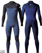
A: SLATE B: BLACK Sbks: BLACK Shoulder logo:WHT

サーファーが水中で長時間効率的な保温をするために効果的なパネルレイアウトでデザイン。ストレッチマテリアルCSD3を採用し、ゾーンA/ゾーンB/ゾーンCのレイアウトで2/2/2mm, 3/2/2mm, 3/3/2mm, 3/3/3mmから選択可能。革新的なC-ZIPエントリーがさらに改良され高い防水性とスマートな着用感を実現。運動性能を最大限に引き出すFLEXFORM PATTERNINGを採用。コンペティションからフリーサーフィンまで、あらゆるシチュエーションに対応可能なモデル。日本製。