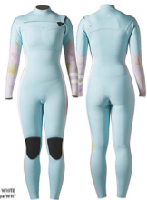
A: ICE BLUE2 B: HIBISCUS C: WHITE Stripe:WHT

コンペティションからフリーサーフィンまで あらゆる女性サーファーに最適な高機能スーツ。