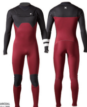
A: WINE B: CHARCOAL Strip: CHARCOAL Stripe-WS

ADVANTAGE PLUSはシンプルなデザインで耐久性とコストパフォーマンスを兼ね備えた、今シーズンデビューするエントリーサーファーに最適なベアシックモデル。HYDROSEAL ENTRY 4.25が標準装備され、オプションでHYDROSEAL ENTRY 4.4またはC-slipにアップグレードもできる。ボディにはストレッチ性とサポート性のバランスがとれたNITROをレイアウトし高いフィットネスを提供する。日本製。