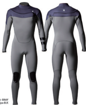
A: CHARCOAL B: GRAY Strip: CHARCOAL Stripe-SIX

高強度にレイアウトされたユニークな伸縮ファスナーがつくる広い開口部のC-COIL ENTRYシステム。ワンシュルダータイプのネックホールが脱着をスムーズに。従来のウェットスーツよりも上体にゆとりを持たせたフィッティングが空気をキープし、自由な運動性と快適な着心地を実現。ファンなコンディションのサーフィンに最適なコンフォートモデル。浸水を最小限に防ぐアクアシルリストカフを標準装備。素材は軽さと運動性を両立させたオールCSD3。