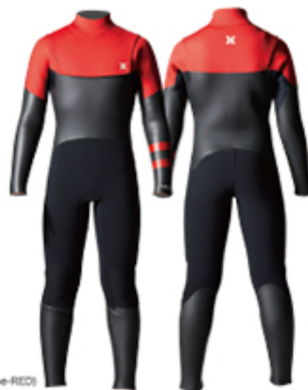
A: RED (OPTION: Stripe-RED)