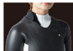
ADJUSTABLE NECK CUFF