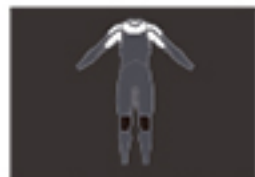
ZL (zipperless) ZL