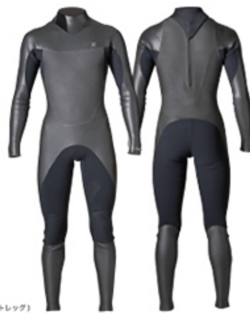
AGT210 (OPTION: ラバーフロントレッグ)

フリーサーフィンからビッグウェーブまで オールラウンドに着られるバックジップモデル。