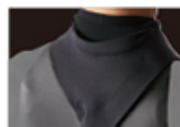
HYDRO NECK SEAL