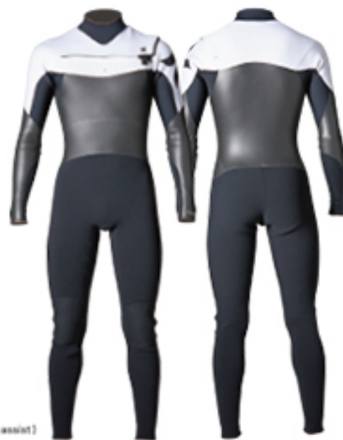
A: WHITE (OPTION: Shoulder logo-WHT, Paddle assist)

サーファーの体温変化をカリフォルニア州立大学サンマルコス校と共同研究を行い、からだの部位ごとの熱の損失量とサーファーのパフォーマンスの関係について明らかにしました。特筆すべきは下半身の表面体温が1℃下がると筋内のパフォーマンスが50%近くも落ちること。ADVANTAGE ELITEはサーファーが水中で長時間効率的な保温をするために効果的なパネルレイアウトでデザインされています。全方向超ストレッチ中空起毛レイヤーS2を採用し、ゾーンA/ゾーンB/ゾーンCのレイアウトでゾーンごとにカスタマイズが可能。運動性能を最大限に引き出すFLEXFORM PATTERNINGを標準装備。エントリーからの浸水を最小限にするインナーネックをオプション選択可能。冬でも軽さとパフォーマンスにこだわるならこの一着。