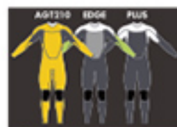
AGT210 EDGE PLUS