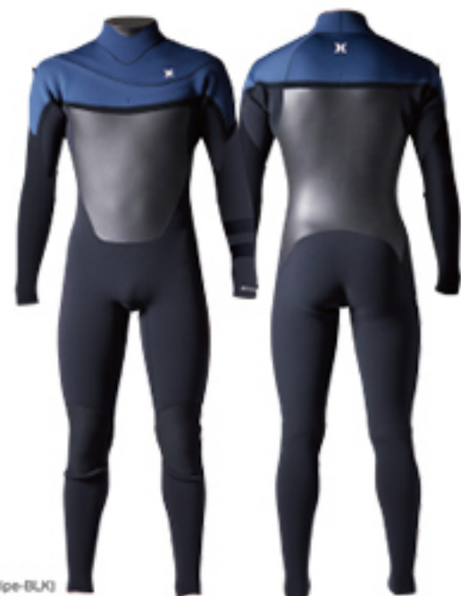
A: SLATE (OPTION: Stripe-BLK)

左右非対称にレイアウトされた伸縮ファスナーがつくるEVO ENTRYシステム。肩の運動を邪魔せずパドルに負担をかけないデザイン。リード側のファスナーの露出を少なくし浸水を最小限に防ぐ（写真はレギュラースタンス用）。ネックホールを引き出すことで着脱をスムーズにアシスト。従来のウェットスーツよりも上体にゆとりを持たせたフィッティングが空気層をキープし、自由な運動性と快適な着心地を実現。ファンなコンディションのサーフィンに最適なコンフォートモデル。マテリアルは軽さと保温性を突き詰めたAGT210、全方向ストレッチ起毛S2をボディにレイアウトしたEDGE、さらに軽さとコストパフォーマンスのPLUSからカスタマイズ可能。