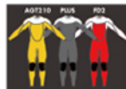
AGT210 PLUS FD2