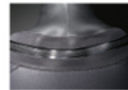
YKK AQUASEAL ZIPPER