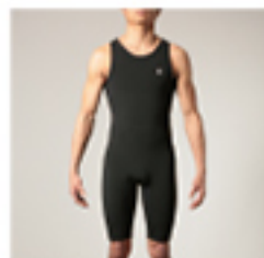
M#PCSJ M HYPER WARM COMPRESSION SHORT JOHN ・サイズ: S, M, L ¥19,800