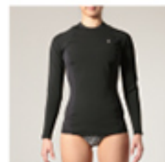
G#PLST W HYPER WARM COMPRESSION LS TOP ・サイズ: XS, S, M ¥14,300