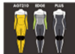
AGT210 EDGE PLUS

EDGE/PLUS A: PLUMERIA, B: PLUMERIA, C: WHITE (OPTION: Stripe-White)