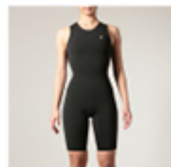
G#PCSJ W HYPER WARM COMPRESSION SHORT JOHN ・サイズ: XS, S, M ¥18,700