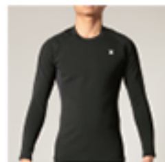
M#PLST M HYPER WARM COMPRESSION LS TOP ・サイズ: S, M, L ¥15,400

理想的な体温によってパフォーマンスを生むウェットスーツ専用アンダーレイヤーハイパーウォームは、レイヤリングによって寒さを遮断し、最高のパフォーマンスを可能にします。立体構造で、保温性に優れた THERMO LIGHT V2 (P15 参照) をラミネートした 0.3mm クロロフレンパネルが体から放出された熱エネルギーを外に逃がさず反射し、暖かくさらりとした状態で保温。軽量で伸縮性のあるウーブン素材がスリット状にレイアウトされ、フィット感とホールド感のあるサポート力を提供します。