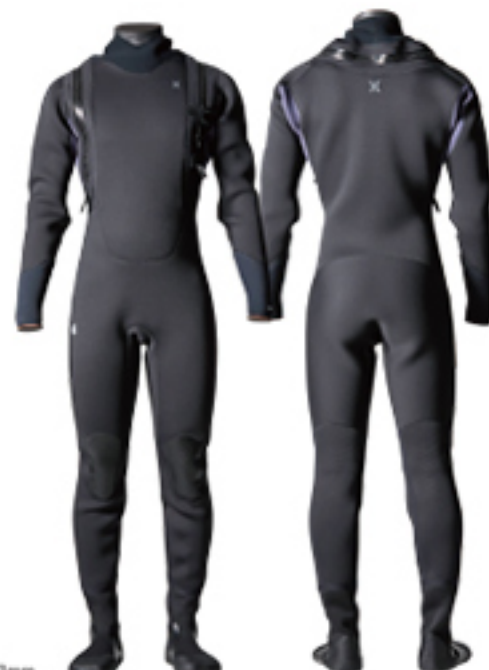
A: CHARCOAL w/WATER LOCK BOOTS 3mm

肩の運動範囲からファスナーを排除し引きつれやストレスがないラウンドタイプのジッパーを採用。ファスナーの開閉をひとりでも確実にこなせるユーティリティデザイン。ダブルアップネックシームとダブルリストカフ標準で防水性は最高レベル。ボディは着脱性と柔軟性に優れたFD2(3.5mm)、または運動性と保温性に優れたAGT210から選択可能。一体構造の足元は、Radial SOXが標準装備。耐久性に優れたウォーターロックブーツ(3mm or 5mm)はオプション。水密検査済。