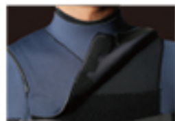
HYDROSEAL ENTRY 4.2

ADVANTAGE PLUSはシンプルなデザインで耐久性とコストパフォーマンスを兼ね備えた、今シーズンデビューしたエントリーサーファーに最適なベーシックモデル。HYDROSEAL ENTRY 4.2Sを採用。メッシュスキンを胸と背中パネルに配置し体幹部分の冷えを抑えます。保温性と着心地のバランスのよい吸湿発熱素材AEROBLINDをボディに採用。胸からの浸水を抑えるDRYCUFFを標準装備。HYDROSEAL 4.4またはC-ZIPにもアップグレード可能。