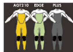
AGT210 EDGE PLUS