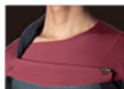
C-ZIP ONE SHOULDER OPTION