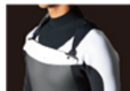
C-ZIP INNER NECK/OPTION