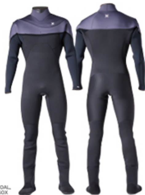
A: CHARCOAL w/RADIAL SOX

肩の運動を邪魔せずパドルに負担をかけないEVOデザイン。リード側のファスナーの露出を少なくし浸水を最小限に防ぐ（写真はレギュラースタンス用）。ネックホールを引き出すことで着脱をスムーズにアシスト。防水耐久を高める最小限のシームデザインを採用。上体にゆとりを持たせたフィッティングで軽い動きと着心地が特徴。素材は、シームの耐久性が高く軽くて乾きが速い3.5mm FD2、運動性と保温性を突き詰めたAGT210、さらに軽さとコストパフォーマンスのPLUSからカスタマイズ可能。ダブルアップネックシーム標準装備。足元はRadial SOXが標準装備。耐久性に優れたウォーターロックブーツ(3mm or 5mm)はオプション。水密検査済。