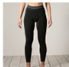
G#PCPT W HYPER WARM COMPRESSION TIGHTS ・サイズ: XS, S, M ¥12,100