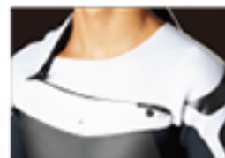
C-ZIP ONE SHOULDER