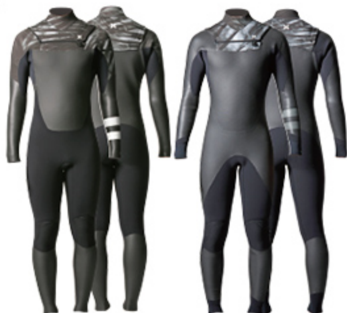
PLUS A: PALM (OPTION: Stripe-WHT)