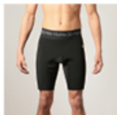
M#PCMS M HYPER WARM COMPRESSION SHORTS ・サイズ: S, M, L ¥10,780