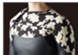
ONE SHOULDER INNER