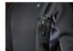
ROUND ZIPPER LAYOUT