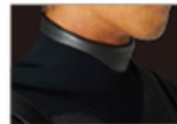
DOUBLE UP NECK SEAL