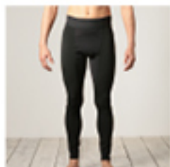
M#PCPT M HYPER WARM COMPRESSION TIGHTS ・サイズ: S, M, L ¥13,200