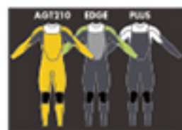
AGT210 EDGE PLUS