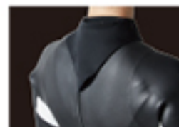
HYDRO NECK SEAL