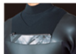
HYDRO SEAL ENTRY