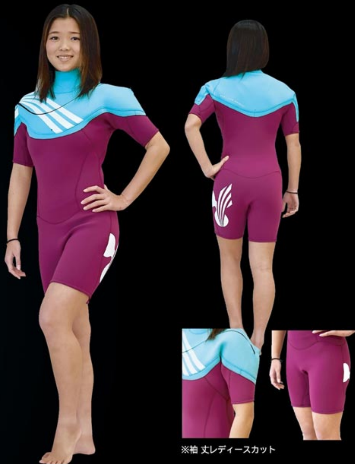
※袖 丈レディースカット