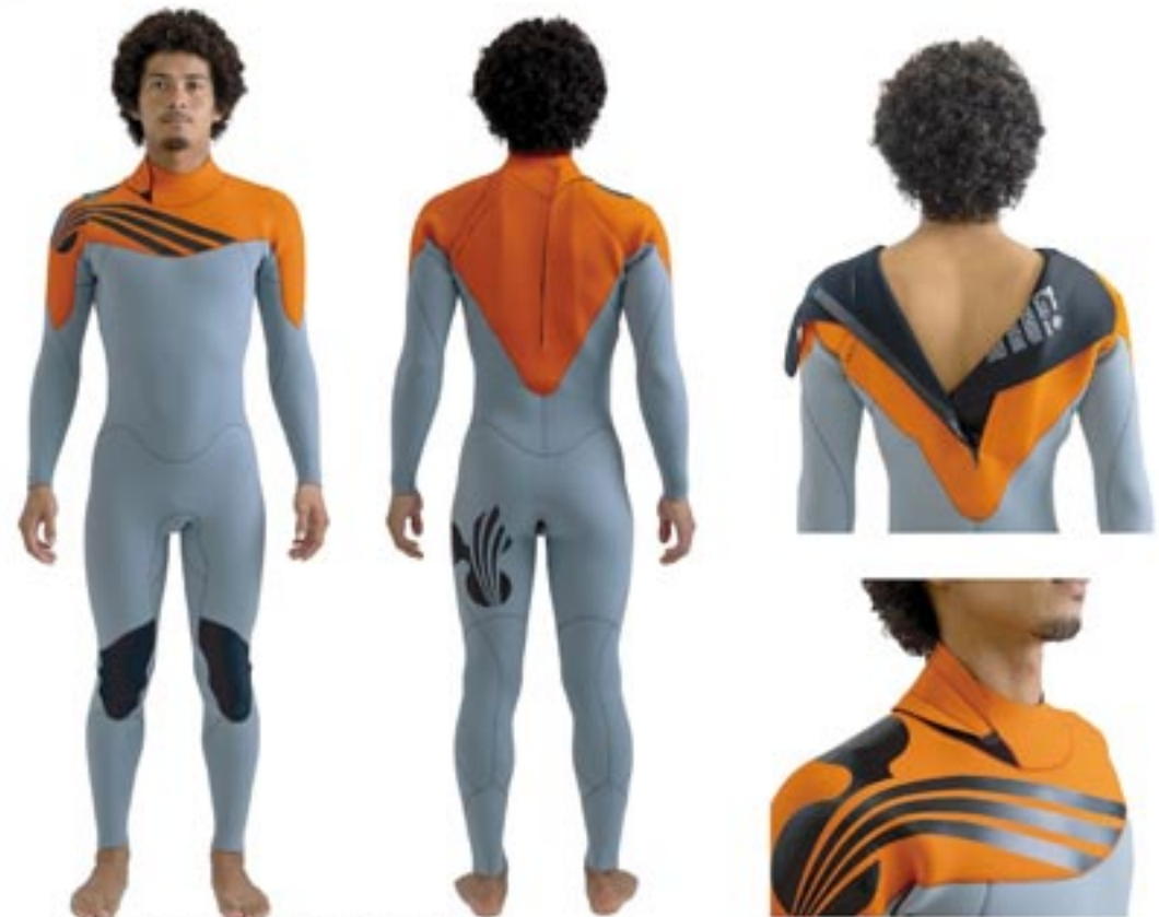
GTR 360 X BZ / SF 23 FL Color/ フラップ: Org . ボディー: Ccl Mark/ 胸 B1/BLK . 背 B2/BLK