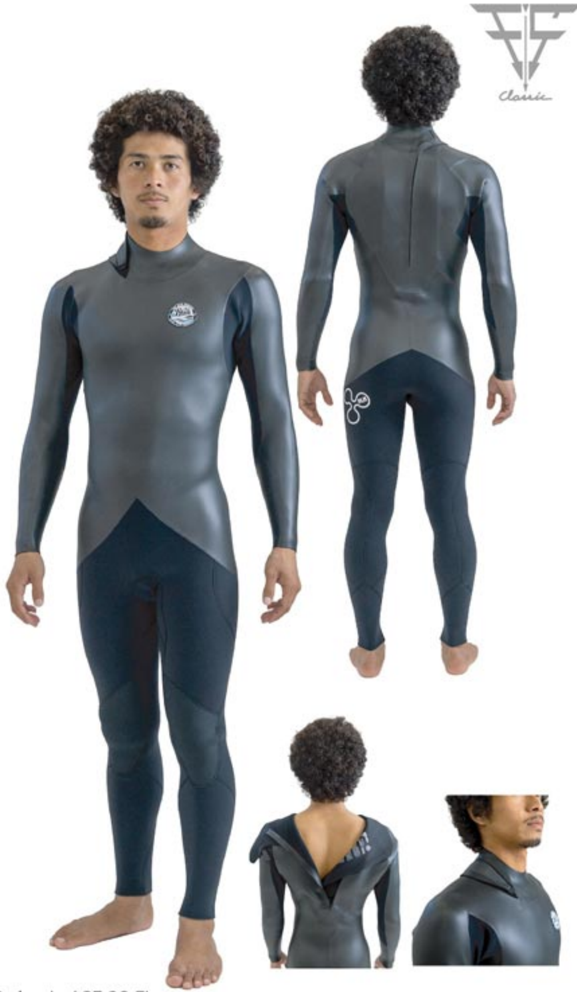
E' S classic / SF 32 FL Color/ 上半身: SKIN . 下半身: BLK Mark/ 左胸 SW4 . 左尻 S9/WHT

クラシカルな風合い、雰囲気コンセプトにしたバックジップシステムのウエットスーツ。ファスナーレイアウトを斜めに配置することで背中へのストレスを大幅に減らします。胸のワッペンがポイント。 ※指定のない場合のSKINタイプはフラットスキンになります。