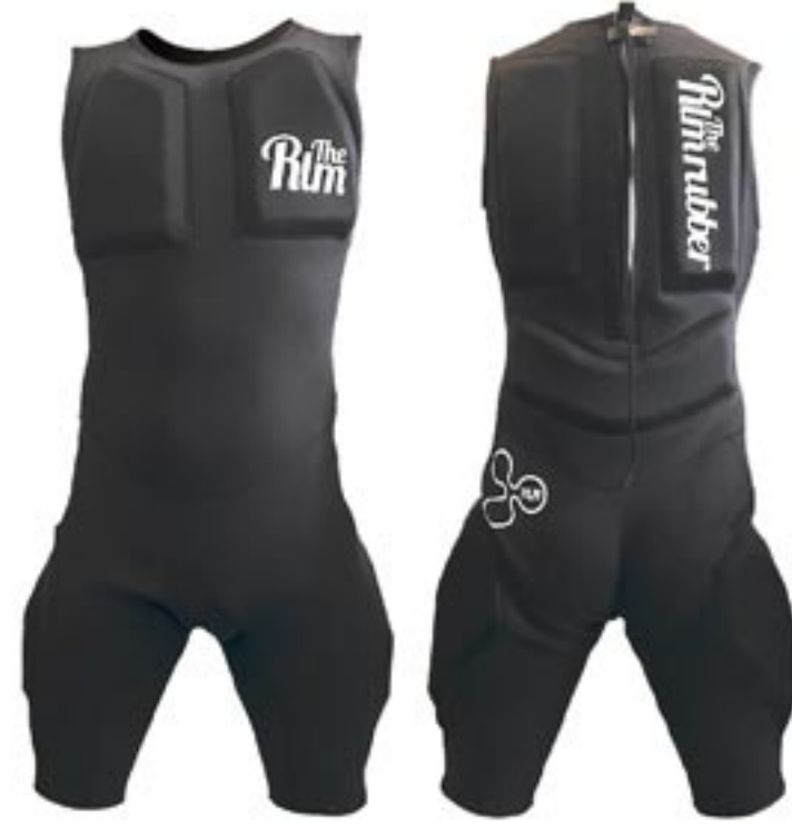
S/John : 7箇所フロート