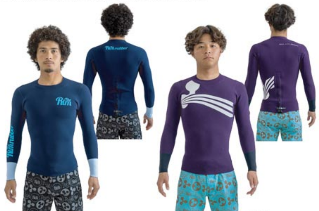
GTR Tapper X / SF 2 Color/ 手首: Blk . ボディー: Mby Mark/ 胸 B1/WHT . 背 B2/WHT