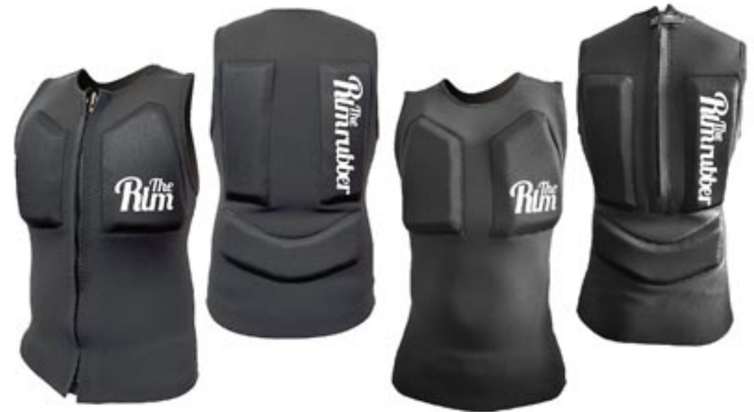
VEST/FZ : 5箇所フロート