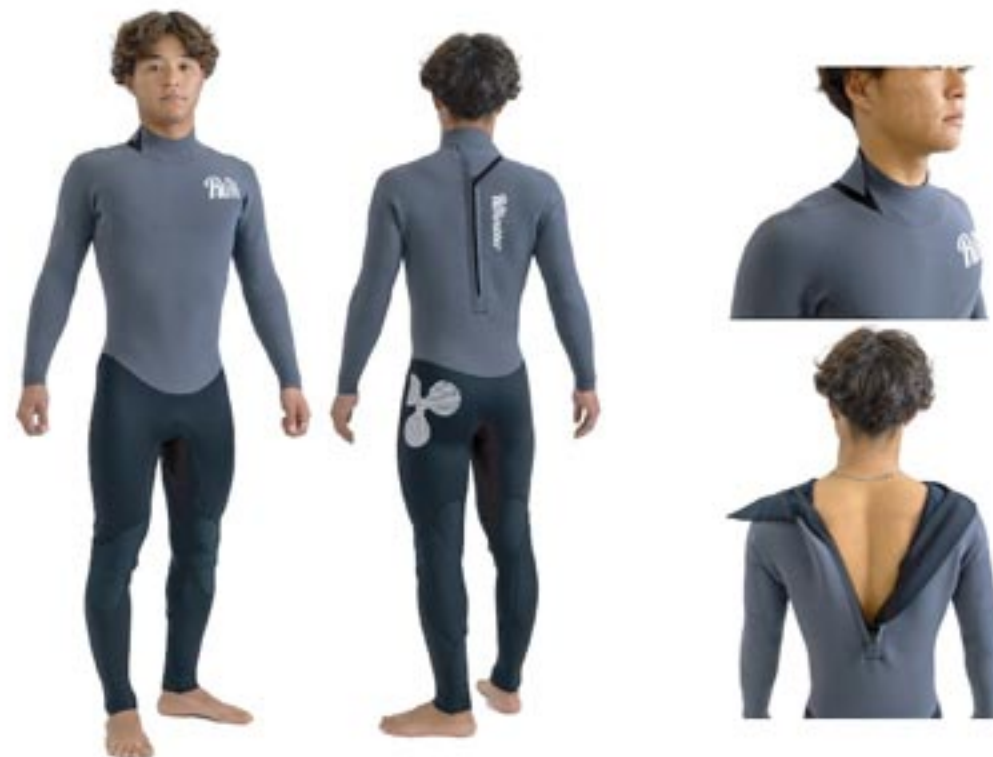
LTD PC BZ / SFxZOOM 3 FL Color/ 上半身: Ccl Mark/ 左胸 S3M/WHT . 背中 S2M. 左尻 S8/WHT

バックジップシステムを低価格にご提案。 上半身にSF、下半身 ZOOMBK 固定を使用したモデルとなっています。