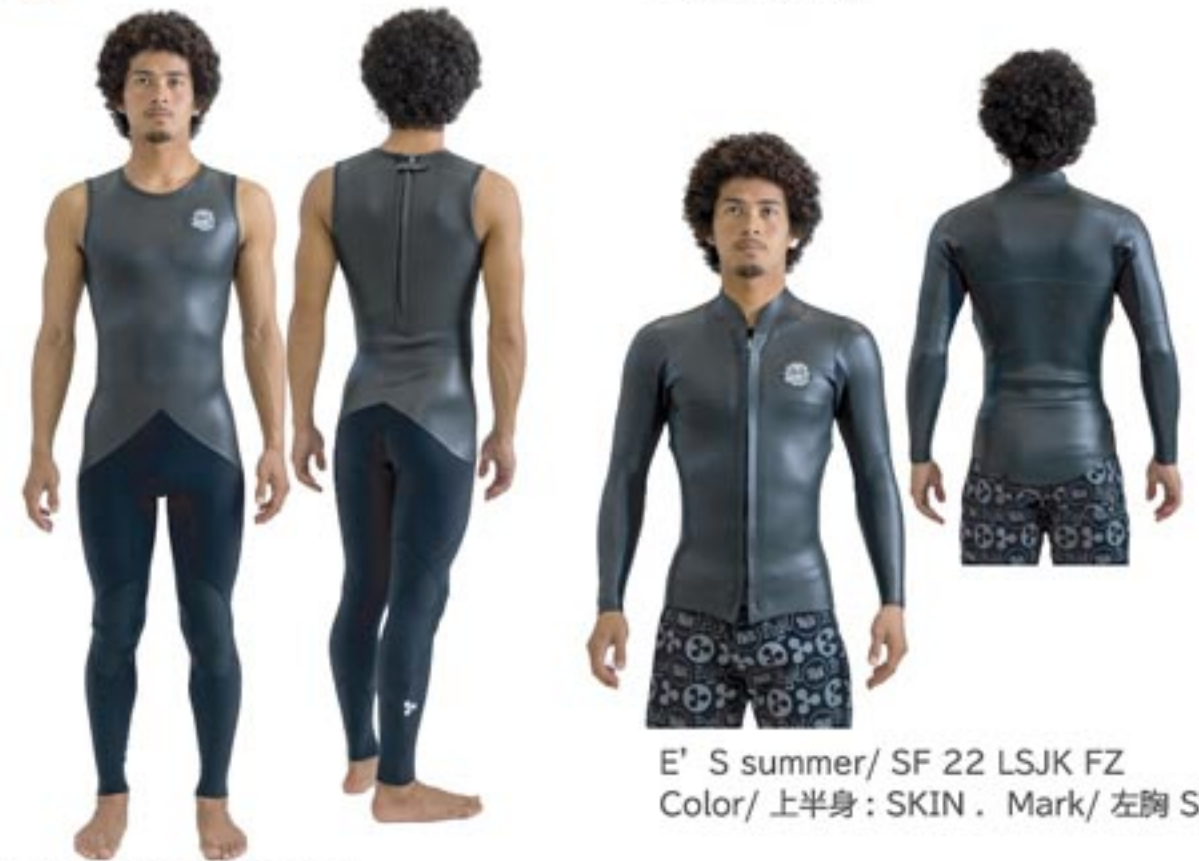
E' S summer / SF 22 Lj Color/ 上半身: SKIN . 下半身: BLK Mark/ 左胸 SW4 . 足首 S7S/WHT