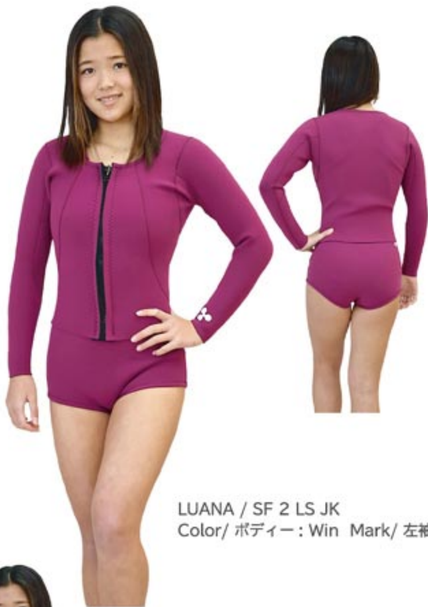
LUANA / SF 2 LS JK Color/ ボディー: Win Mark/ 左袖 S7/WHT

ALL2mm の summer シリーズがウィメンズシリーズにラインナップ レディースカットで気になる日焼けラインを隠します。