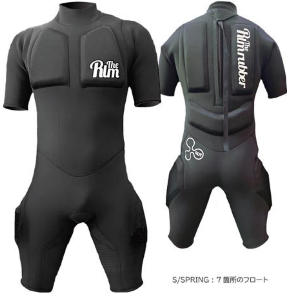
S/SPRING : 7箇所フロート