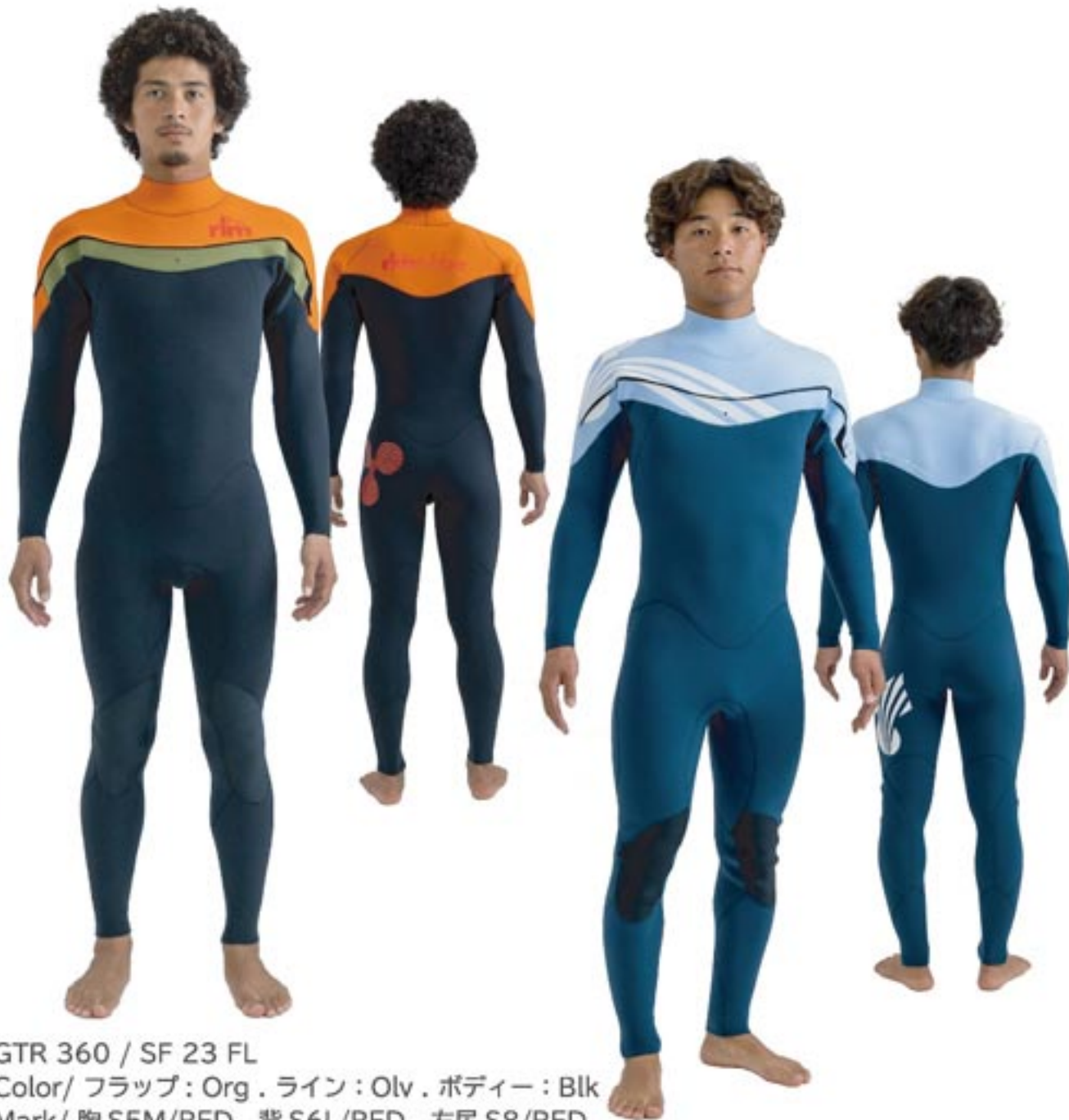
GTR 360 / SF 23 FL Color/ フラップ: Org . ライン: Olv . ボディー: Blk Mark/ 胸 S5M/RED . 背 S6L/RED . 左尻 S8/RED

圧倒的な着脱の良さで好評なチェストエントリーシステムに運動性と保温性を追求した [GTR] モデル。上半身パーツを最小にすることでパドリング時のストレスを感じさせません。こだわり抜いたパネル構造でどなたにもフィットします、是非お試しください。