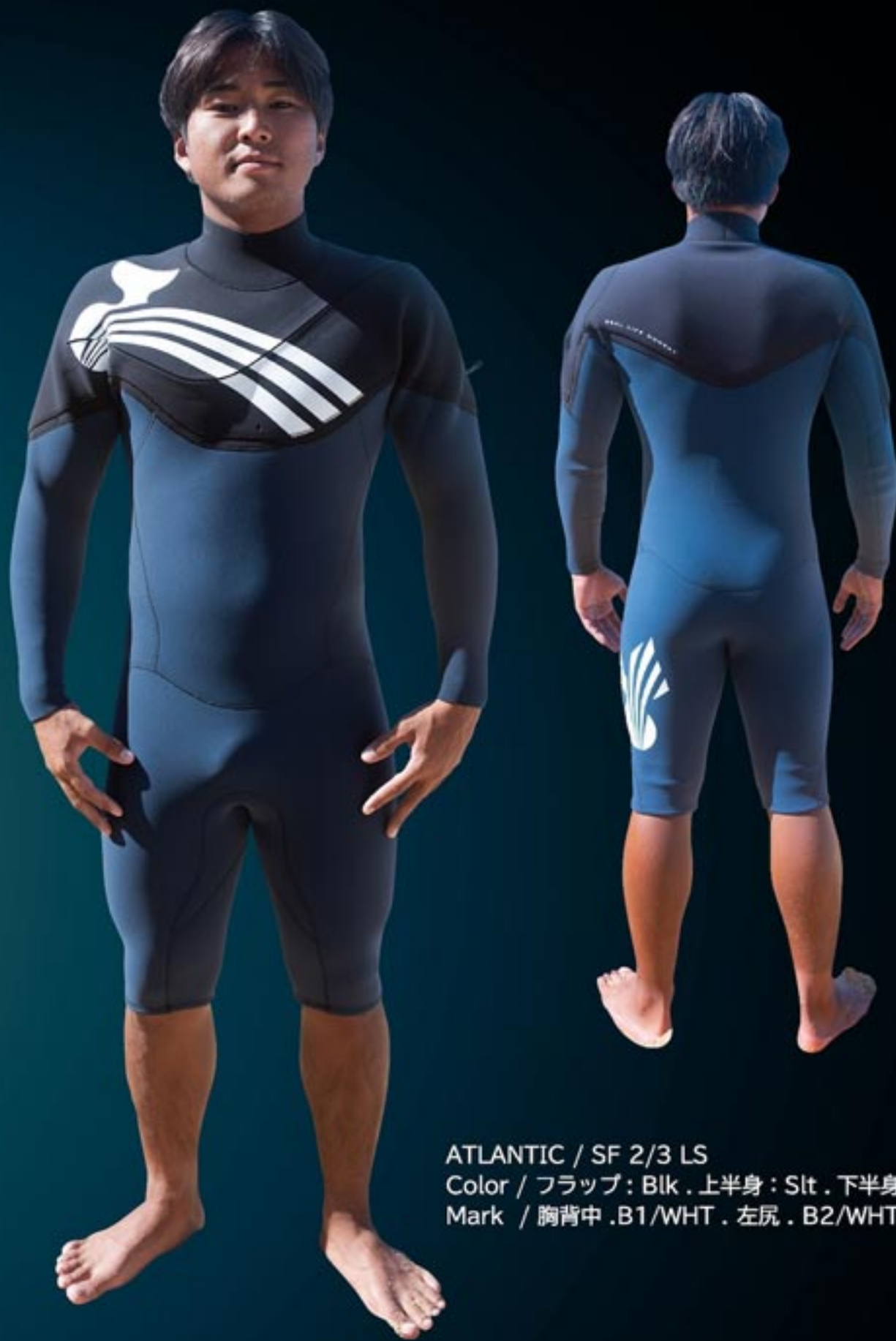
ATLANTIC / SF 2/3 LS Color / フラップ: Blk . 上半身: Slr . 下半身: Slr Mark / 胸背中 .B1/WHT . 左尻 . B2/WHT

新たな zip レイアウト (AT zip system) によりパドル時のストレスを大幅に軽減、より運動性能が向上しています。 360° インナー標準仕様により水の浸入も軽減、動きやすくて暖かい 究極のスーツとなっております。 ATLNTIC / AT zip system を是非ご体感してみてください。