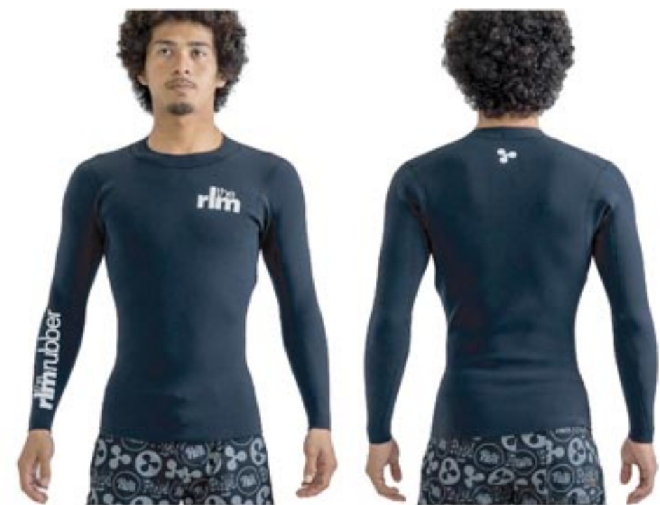
INDIAN summer / SF 1.5 TP Color/ 上半身: BLK Mark/ 左胸 S5M/WHT . 右袖 S6L/WHT . 背中 S7S/WHT