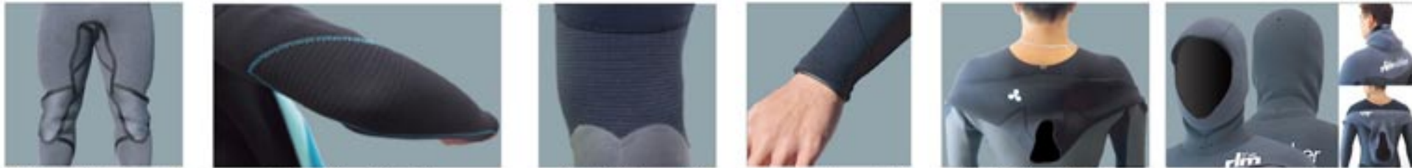
バブルガムテープ エルボーパッド タフジャージ リストホールド 360° インナー フード

バブルガムテープ / 耐久性をアップさせるバブルガムテープは、裏側の貼り合わせ部分に貼ることで、針穴の広がりを最小限に防ぎます。更にバブルガムテープは高伸縮素材なので、運動性を低下させずストレスを全く感じさせません。リスト・アングル ホールド / 手首、足首のホールドが増し、スキン面が肌に密着するので水の吸い上げを最小限に防ぎ防水性がアップ。膝裏タフジャージ / 耐久性に優れたタフジャージを膝裏に使用する事で、ニーリーシュによるスレを最小限に防ぎます。エルボーパッド / 耐久性に優れたタフジャージを使用。潰れや磨耗による擦り切れを最小限に防ぎます。シリコンパッドに比べ伸縮性があるので、運動性にも優れています。