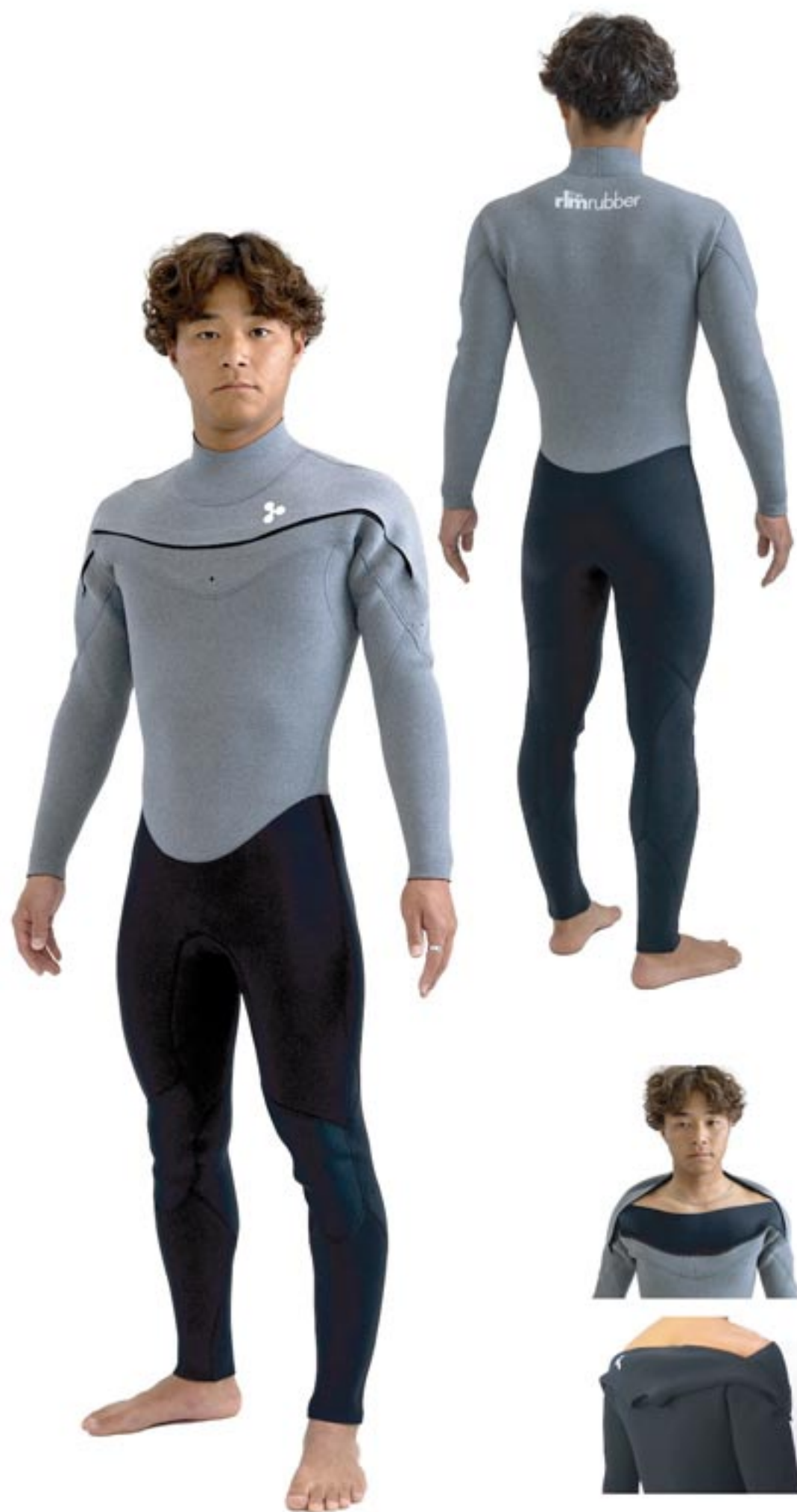
LTD GTR Light / SFxZOOM 3 FL Color/ 上半身: SJBLK Mark/ 左胸 S7S/WHT . 背中 S6M/WHT

圧倒的な着脱の良さで好評なチェストエントリーシステムを低価格にご提案。 上半身にSF、下半身 ZOOMBK 固定を使用したモデルとなっています。